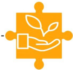
環境保護と 持続可能性