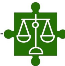
リスクアセスメント